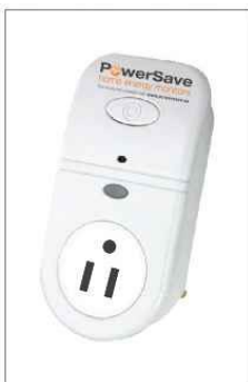
Refrigerador - Equipo #4 - MI